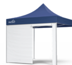
Standard avec porte