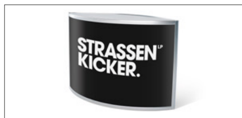
Comptoir des orchidées (exemple d'impression)