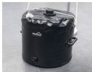
Poids de l'eau