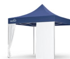
Rideau fermeture à éclair centrale**