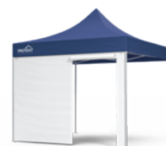
Standard avec porte