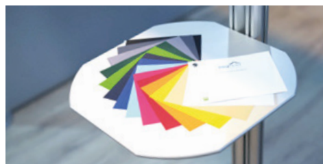
Table de rangement design