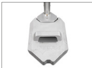
Plateau de poids 12,5 kg, empilable, hexagonal