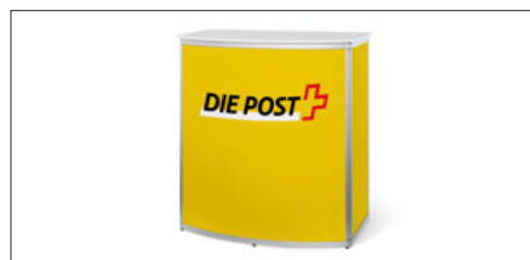
Comptoir compact (exemple d'impression)