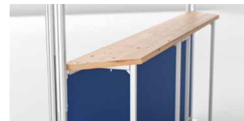
Comptoir de bar